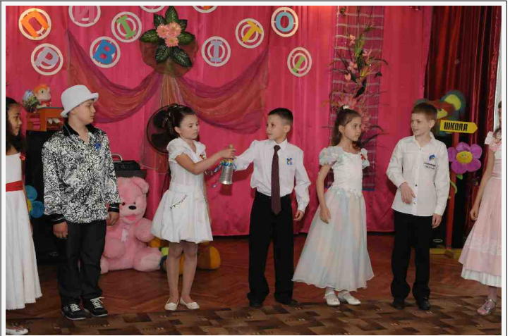
Elkeen kry 'n kans om die skoolklok vir oulaas te lui