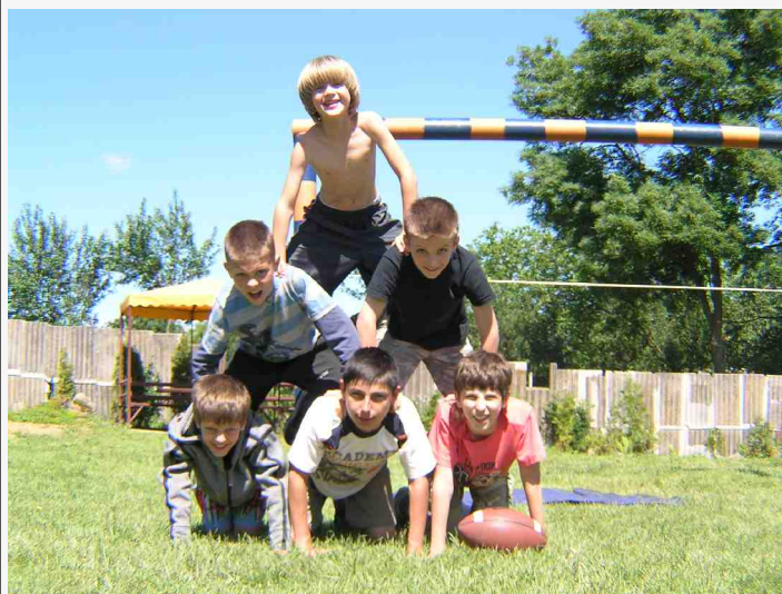
Die kinders het hulle eie program