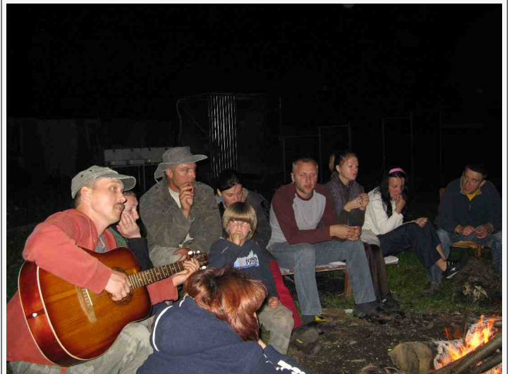
Die kampvuur is altyd 'n treffer