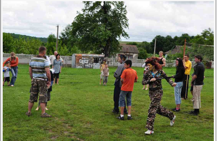
Gesin-sport: Almal neem deel