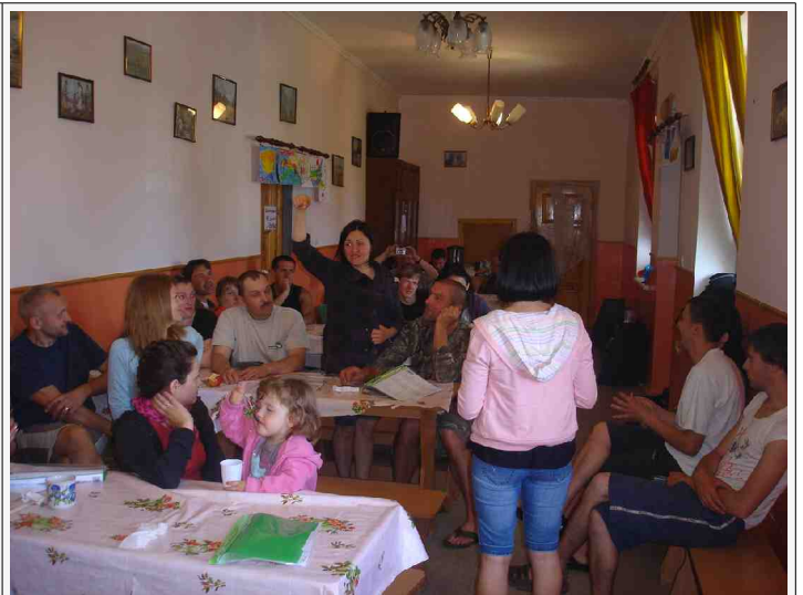
Alla maak afkondigings gedurende die kamp